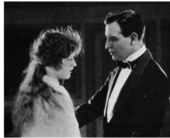
1920 FOLIES D'AVRIL (April Folly) de Robert Z. Leonard avec Conway Tearle