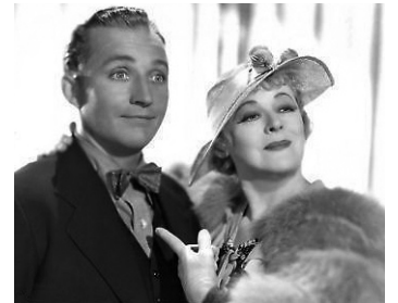
1933 AU PAYS DES RÊVES (Going Hollywood) de Raoul Walsh avec Bing Crosby