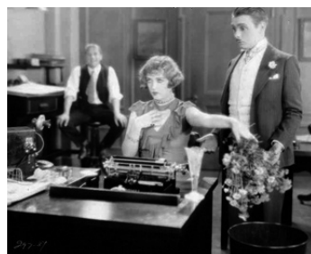
1927 TILLIE THE TOILER de Hobart Henley avec George K. Arthur