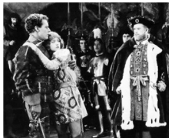
1922 SUR LES MARCHES DU TRÔNE (When Knightwood was in Flower) de Robert Vignola