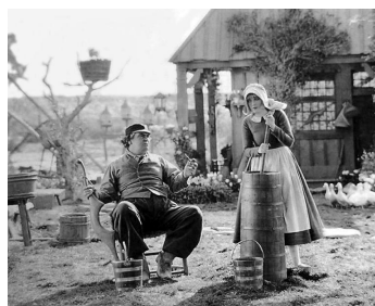
1927 LE MOULIN ROUGE (The red Mill) de Roscoe Arbuckle de George Siegmann