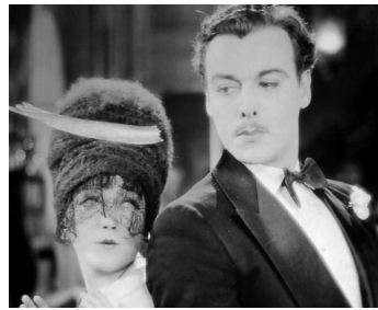
1928 L'AMANT DE PAPIER (Her Cardboard Lover) de Robert Z. Leonard avec Nils Asther