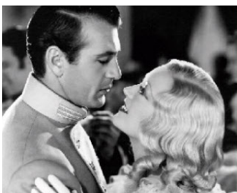
1934 AGENT 13 (Operator 13) de Richard Boleslawski avec Gary Cooper