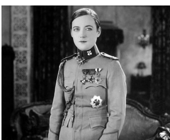
1926 BEVERLY OF GRAUSTARK de Sidney Franklin