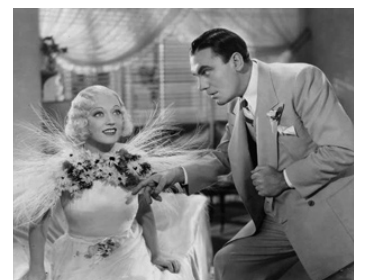
1934 REINE DE BEAUTÉ (Page Miss Glory) de Mervyn Le Roy avec Pat O'Brien