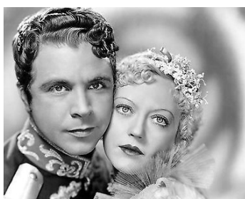
1936 BETSY (Hearts divided) de Frank Borzage avec Dick Powell