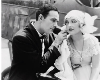
1928 MIRAGES (Show People) de King Vidor avec William Haines