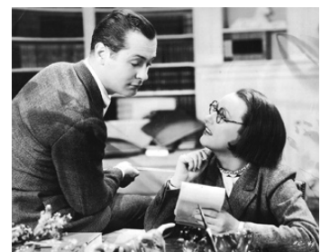
1937 BATAILLE DE DAMES (Ever since Eve) de Lloyd Bacon avec Robert Montgomery