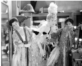
1930 FLORADORA GIRL ou THE GAY NINETIES de Harry Beaumont