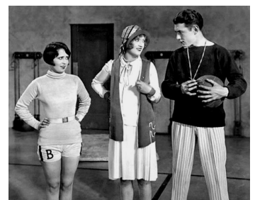
1927 LE BEL ÂGE (The Fair Co-ed) de Sam Wood avec Thelma Hill, Johnny Mack Brown