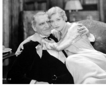
1930 LE PÈRE CÉLIBATAIRE (The Bachelor Father) de Robert Z. Leonard avec C. Aubrey Smith