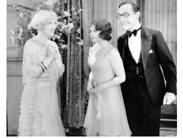
1930 DULCY (Not so dumb) de King Vidor avec Sally Starr, Franklin Pangborn