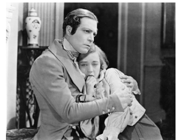
1923 PATRICIA (Little Old New York) de Sidney Olcott avec Harrison Ford