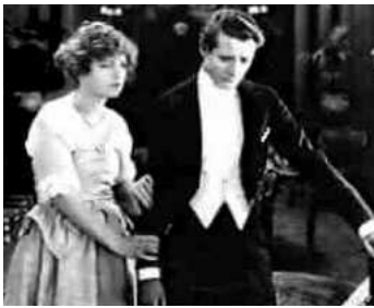
1918 CECILIA OF THE PINK ROSES de Julius Steger avec Edward O'Connor