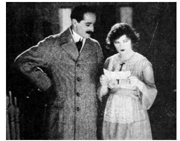
1919 GETTING MARY MARRIED d'Allan Dwan avec Norman Kerry