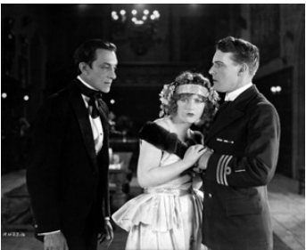
1922 LA VIERGE FOLLE (The Young Diana) d'A. Capellini & R. Vignola avec Pedro de Cordova