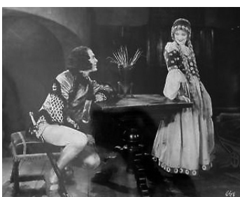
1924 YOLANDE (Yolanda) de Robert Vignola avec Holbrook Blinn