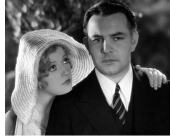
1931 IT'S A WILD CHILD de Robert Z. Leonard