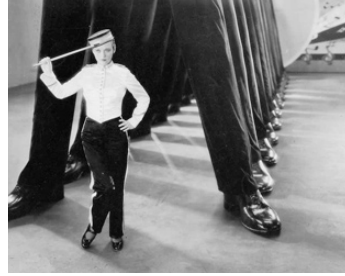
1929 HOLLYWOOD CHANTE ET DANSE (The Hollywood Revue of 1929) de Charles Reisner