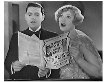
1928 THE FIVE O'CLOCK GIRL de Robert Z. Leonard avec Joel McCrea