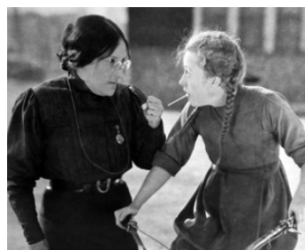
1925 L'AMAZONE (Zander the Great) de George W. Hill