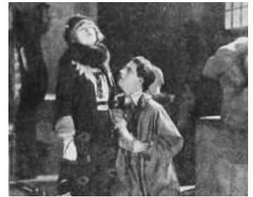
1920 THE RESTLESS SEX de Robert Z. Leonard avec Carlyle Blackwell Jr