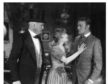
1925 LES LUMIÈRES DE NEW YORK (Lights of Old Broadway) de Monta Bell avec Conrad Nagel