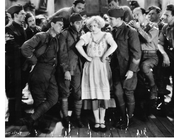
1930 MARIANNE (Marianne) de Robert Z. Leonard (en deux versions)