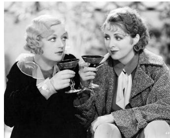
1932 LA REINE DES GIRLS (Blondie of the Follies) d'Edmund Goulding avec Billie Dove