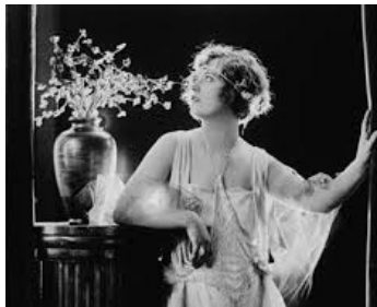
1920 ENCHANTEMENT (Enchantment) de Robert Vignola