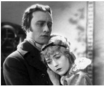
1927 LA GALANTE MÉPRISE (Quality Steet) de Sidney Franklin avec Conrad Nagel