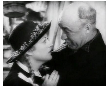
1933 PEG DE MON CŒUR (Peg o'my Heart) de Robert Z. Leonard