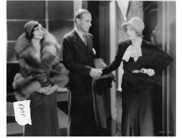
1931 FILLE DE LUXE (Five and Ten) de Robert Z. Leonard avec Leslie Howard