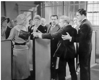
1931 TRAPÈZE (Polly of the Circus) d'Alfred Santell